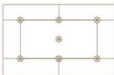
6 szt./m 2