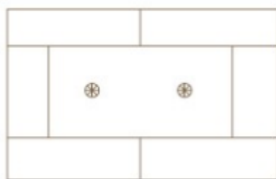
4 szt./m 2

Płyty materiału termoizolacyjnego po nałożeniu muszą stanowić równą powierzchnię. Po związaniu zaprawy klejącej i po zamocowaniu mechanicznym płyt do podłoża należy całą zewnętrzną powierzchnię przeszliować gruboziarnistym papierem ściernym lub przy pomocy pacy szlifierskiej do styropianu. Po szlifowaniu należy usunąć pozostały pył. Nie należy pozostawiać warstwy termoizolacji bez osłony przez dłuższy czas, gdyż może to doprowadzić do zniszczenia powierzchni styropianu przez promieniowanie UV, a w konsekwencji, do osłabienia warstwy zbrojonej.