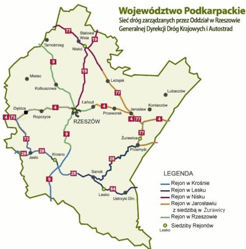
Mapa 1. Wykaz dróg krajowych (w tym autostrad i szybkiego ruchu) zlokalizowanych w województwie podkarpackim