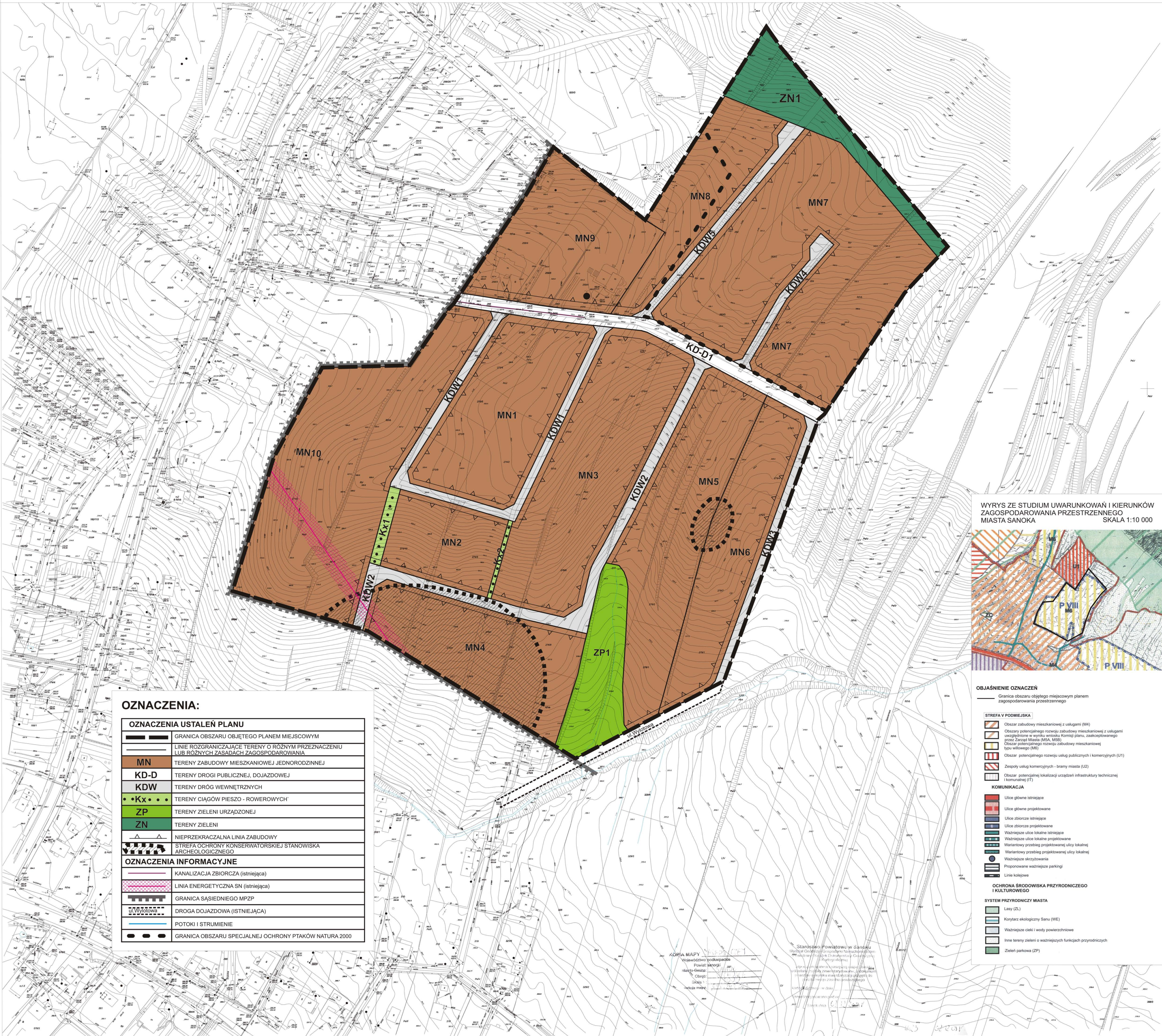
WYRYS ZE STUDIUM UWARUNKOWAŃ I KIERUNKÓW ZAGOSPODAROWANIA PRZESTRZENNEGO MIASTA SANOKA SKALA 1:10 000